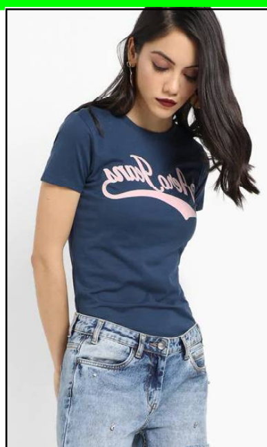
ଲଇ ସର୍ଟ :

ସର୍ବ ପ୍ୟାଶ : ଯଦି ଚୋର ଟ୍ରିପ୍‌ର ପ୍ଲାନ କରୁଛନ୍ତି, ଏଥିପାଇଁ ସର୍ବ ପ୍ୟାଶ ଭଲ ହେବ । ସର୍ବସ୍ୱ ସହିତ ଛୋଟ ଫୁଲ୍ ରି ସାର୍ଟ ପିନ୍ଧିପାରିବେ । ସ୍ୟାଣ୍ଡେଲ ଲାଗାରେ କାନଭାସ୍ ଲୋଡା କ୍ୟାରି କଲେ ପାଦକୁ ଆରାମ ଲାଗିବ ସହିତ ଷ୍ଟାଇଲିଂ ଲୁକ୍ ପାଇପାରିବେ ।