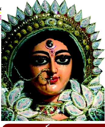
ଯା ଦେବୀ ସର୍ବଭୂତେଷୁ.....