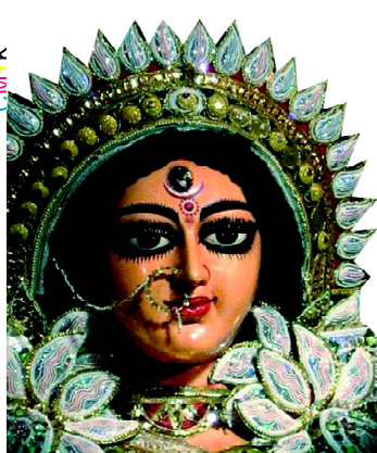
ସା ଦେବୀ ସର୍ବଭୂତେଷୁ.....