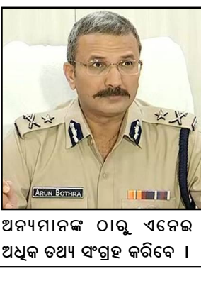
ଅନ୍ୟମାନଙ୍କ ଠାରୁ ଏନେଇ ଅଧିକ ତଥ୍ୟ ସଂଗ୍ରହ କରିବେ ।