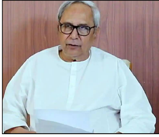
ସେବା ଖଣିକ ପ୍ରବନ୍ଧନ ଅନୁଲୋଚନା ବିଭିନ୍ନତା ଏବଂ ଉତ୍ତୋଳିତ ଖଣିକ ପ୍ରବନ୍ଧନ ପରିଚାଳନାରେ

ଭୁବନେଶ୍ୱର, ୦୧।୧୨ (ନି.ପ୍ର): ମୁଖ୍ୟମନ୍ତ୍ରୀ ଶ୍ରୀ ନବୀନ ପଟ୍ଟନାୟକ ମଙ୍ଗଳବାର ଭିଡିଓ କନଫରେନ୍ସ ମାଧ୍ୟମରେ ଓଡ଼ିଶା ଖଣି ନିଗମ (ଓଏମ୍‌ସି) ର ଗ୍ରାହକ ଇଂଡିଗ୍ରେଡେଟ୍ ମ୍ୟାନେଜମେଣ୍ଟ ସର୍ଭିସେସ୍ (ସିଆଇଏମ୍‌ଏସ୍) ଏବଂ ଷ୍ଟକ୍‌ସର୍ଭିସ୍ ମ୍ୟାନେଜମେଣ୍ଟ ସିଷ୍ଟମ୍ (ଏସ୍‌ଏମ୍‌ଏସ୍) ଆୟର ଶୁଭାରମ୍ଭ କରିଛନ୍ତି । ସିଆଇଏମ୍‌ଏସ୍ ଦ୍ୱାରା ଗ୍ରାହକମାନେ ବର୍ତ୍ତମାନ ପଞ୍ଜୀକରଣ, ଅର୍ଡର ଏବଂ ଷ୍ଟକ୍‌ଗୁଡ଼ିକର ମୂଲ୍ୟାଙ୍କନ, ସାମ୍ବାହିକ ରିପୋର୍ଟ, ଅର୍ଡର ସ୍ଥିତି, ଅଂଚଳ ଅନୁଯାୟୀ ମୋଟ ବିକ୍ରୟ, ଅଭିଯୋଗ ସ୍ଥିତି ସମ୍ପର୍କରେ ଜାଣିପାରିବେ । ସେହିପରି ଷ୍ଟକ୍‌ସର୍ଭିସ୍