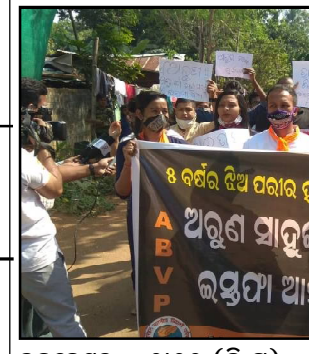
ଭୁବନେଶ୍ୱର, ୦୧।୧୨ (ନି.ପ୍ର): ବିଧାନସଭାର ଶୀତ ଅଧିବେଶନ ମାତ୍ର ୧୦ ଦିନ ରେ ମୂଳତତ୍ତ୍ୱ କରିଦିଆଗଲା । ବେକାରୀ, ପ୍ରଧାନମନ୍ତ୍ରୀ ଆବାସ ଯୋଜନା ଅନିୟମିତତା, ନରୋଗ ଯୋଜନା