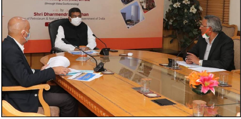
ରୂଆଦିଲ୍ଲୀ/ ଭୁବନେଶ୍ୱର, ୦୧।୧୨ (ନି.ପ୍ର): ଆଗାମୀ ୫ ରୁ ୭ ବର୍ଷ ମଧ୍ୟରେ ଦେଶରେ ୧୦ ହଜାର ସିଏନଜି ଷ୍ଟେସନ ପ୍ରତିଷ୍ଠା ଏବଂ ୫ କୋଟି ପିଏନଜି ସଂଯୋଗ ପାଇଁ ଭାରତ ସରକାର ଯୁକ୍ତକାଳୀନ ଭିଡିଓ କାମ କରୁଛନ୍ତି ବୋଲି ମଙ୍ଗଳବାର ରୂଆଦିଲ୍ଲୀରୁ ଭିଡିଓ କନଫରେନ୍ସ କରିଆରେ ମହାରାଷ୍ଟ୍ର ପ୍ରାକୃତିକ ଗ୍ୟାସ କମ୍ପାନୀ (ଏମ୍‌ଏନଜିଏଲ୍)ର ୫ଟି ଗ୍ୟାସ ଷ୍ଟେସନ ରାଷ୍ଟ୍ର ଉଦ୍‌ଘାଟନରେ ଉଦ୍‌ଘାଟନ କରିବା ଅବସରରେ କହିଛନ୍ତି କେନ୍ଦ୍ରମନ୍ତ୍ରୀ ଧର୍ମେନ୍ଦ୍ର ପ୍ରଧାନ । ଉଲ୍ଲେଖନୀୟ ଯେ, ଏହି ୫ଟି ଗ୍ୟାସ

୧୦ ହଜାର ସିଏନଜି ଷ୍ଟେସନ ପ୍ରତିଷ୍ଠା ସହ ୫ କୋଟି ପିଏନଜି ସଂଯୋଗ ଲକ୍ଷ୍ୟ : ଧର୍ମେନ୍ଦ୍ର