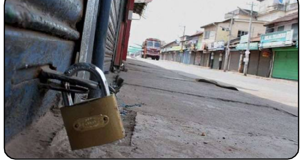
ଭୁବନେଶ୍ୱର, ୨୫.୧୧ (ନି.ପ୍ର): ଆସନ୍ତାକାଳି (ଗୁରୁବାର) କେନ୍ଦ୍ରୀୟ ଶ୍ରମିକ ଫ଼ାଙ୍ଗନ ଓ କୃଷକ ଫ଼ାଙ୍ଗନ ପକ୍ଷରୁ ଭାରତ ବନ୍ଦର ଘୋଷଣା ଦିଆଯାଇଛି । ସରକାରୀ କ୍ଷେତ୍ରର ଘରୋଇକରଣ, ନୂଆ କୃଷି ଆଇନ ଓ ଶ୍ରମିକ ମାରଣ ନୀତି ବିରୋଧରେ ଏହି ଭାରତ ବନ୍ଦ