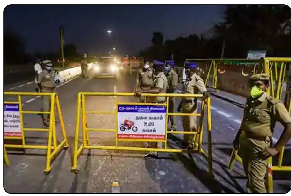
ଜାରି କରିଛି । ଏହି ଗାଇଡ଼ ଲାଇନ୍ ଦର୍ଶକ ଶେଷ ଯାଏ ବକ୍ସର ଉପରେ ରହିବ । ତେବେ ଆର୍ଡ଼ଜାତୀୟ ବିମାନ ଚଳାଚଳକୁ ଅନୁମତି ଦେଇଛି ଗୃହ ମନ୍ତ୍ରାଳୟ । ୫୦ ପ୍ରତିଶତ ଦର୍ଶକଙ୍କୁ ନେଇ ତାଲିପାରିବ ସିନେମା ହଲ୍, ଥିଏଟର । କ୍ରୀଡ଼ାବିତଙ୍କ ପାଇଁ ସୁରକ୍ଷା ପୁଲ୍ ଖୋଲା ରଖିବାକୁ ବି ଅନୁମତି ଦେଇଛନ୍ତି ସରକାର । ବ୍ୟାବାସାୟିକ ଉଦ୍ଦେଶ୍ୟରେ ପ୍ରଦର୍ଶନୀ ହଲ୍ ଖୋଲାଯିବାକୁ ଗତକାଳିକରୋନା

ନୂଆଦିଲ୍ଲୀ, ୨୫.୧୧ (ନି.ପ୍ର): ଶୀତ ଦିନରେ କରୋନା ବ୍ୟାପିବାର ସମ୍ଭାବନା ଅଧିକ ରହିଛି । ଏ ନେଇ କେନ୍ଦ୍ର ସରକାର ରାଜ୍ୟ ଏବଂ କେନ୍ଦ୍ର ଶାସିତ ଅଂଚଳକୁ ସତର୍କ କରାଇଛନ୍ତି । ଏବେ ଡିସେମ୍ବର ମାସ ପାଇଁ କେନ୍ଦ୍ର ସରକାର ଗାଇଡ଼ଲାଇନ୍ ଜାରି କରିଛନ୍ତି । ଯେଉଁଥିରେ ଗୃହ ମନ୍ତ୍ରାଳୟ କହିଛି କେନ୍ଦ୍ରମଣ୍ଡଳ କୋର୍ଡ ଆକ୍ରାନ୍ତ କାହା ସହିତ ଯୋଗାଯୋଗରେ ଥିଲେ ତା ଉପରେ ଗୁରୁତ୍ୱ ଦେବାକୁ କହିଛନ୍ତି । ଡିସେମ୍ବର ୧ ତାରିଖରୁ ଏହି ସମସ୍ତ ଦିନ ଉପରେ କଟ୍ଟା ନକର ରଖିବାକୁ କେନ୍ଦ୍ର ସରକାର କହିଛନ୍ତି । ଦେଶର କେତେକ ରାଜ୍ୟରେ କରୋନା ଦିନକୁ ଦିନ ଗଣନା ହେବାରେ ଲାଗିଛି । ଏହି ସମୟରେ ଗୃହ ମନ୍ତ୍ରାଳୟ ମନିଟରିଂ କରିବା ସହିତ ସତର୍କତା ପାଇଁ ନିର୍ଦ୍ଦେଶନାମା