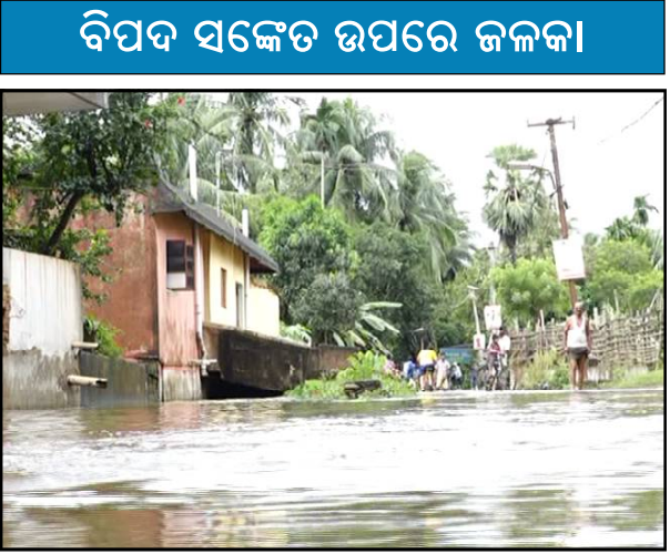
ବିପଦ ସଙ୍କେତ ଉପରେ ଜଳକା

ବାଲେଶ୍ୱର, ୨୭/୮ (ନି.ପ୍ର) : ଉତ୍ତର-ପୂର୍ବ ବଙ୍ଗୋପସାଗରରେ ସୃଷ୍ଟି ହୋଇଥିବା ଲଘୁଚାପ ଯୋଗୁଁ ବାଲେଶ୍ୱର ସମେତ ଉତ୍ତର ଓଡ଼ିଶାରେ ଗତ ୨ ଦିନ ଧରି ଲାଗି ରହିଥିବା ଲଗାଣ ବର୍ଷାରେ ଜନଜୀବନ ପ୍ରଭାବିତ ହେବା ସହ ନଦୀର ଜଳସ୍ତର ବୃଦ୍ଧି ଯୋଗୁଁ ବନ୍ୟା ପରିସ୍ଥିତି ଦେଖାଦେଇଛି । ଗତ କାଲି ଗୋଟିଏ ଦିନରେ ବାଲେଶ୍ୱର ଜିଲ୍ଲାର ୧୨ ଗୋଟି ବ୍ଲକରେ ମୋଟ ୧୦୧୧ ମିଲି ମିଟର ବର୍ଷା ରେକର୍ଡ୍ କରାଯାଇଥିବା ବେଳେ ନାଳଗିରିରେ ସର୍ବାଧିକ ୧୨୨ ମି.ମି ବର୍ଷା ହୋଇଥିବା ଜଣାପଡ଼ିଛି । ତେବେ ଆଜି ସକାଳଠାରୁ ଅବିରାମ ଗତିରେ ବର୍ଷା ଲାଗି ରହିଥିବା ଫଳରେ ଜନଜୀବନ ବିଶେଷ ପ୍ରଭାବିତ ହୋଇଛି । ସହର ସମେତ ଜିଲ୍ଲାର ଲୋକେ ଘରୁ ବାହାରି ପାରୁନଥିବା ବେଳେ ରାସ୍ତାଘାଟରେ ପାଣିପୁଆ ପଡ଼ିଛି । ଅନ୍ୟପକ୍ଷରେ ଏହି ଲଗାଣ ବର୍ଷାରେ ଉତ୍ତର ଓଡ଼ିଶାର ସମସ୍ତ ଜିଲ୍ଲାର ନଦୀମାନଙ୍କରେ ବହୁଥିବା ଜଳପତନ ଯୋଗୁଁ ସ୍ଥାନୀୟ ଲୋକେ ଆତଙ୍କିତ ହୋଇପଡ଼ିଛନ୍ତି ।