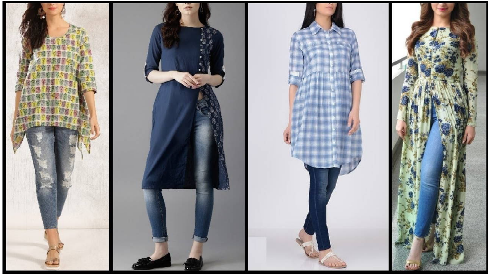
କଲର ଥିବା କୁର୍ତ୍ତି:- କଲର ଥିବା କୁର୍ତ୍ତି ସହ ଆପଣ ଗଜୁକ ମଧ୍ୟ କପାରି କରିପାରିବେ । ଯାହାଦ୍ୱାରା ଆପଣ ବହୁତ କୁଲ ଏବଂ ସେକ୍ସି ଦେଖାଯିବେ ।

କିନ୍ତୁ ପ୍ୟାଶନ୍ ଦିନକୁ ଦିନ ବଢ଼ି ଚାଲିଛି । ଏହାକୁ କୁପଟ୍ ସହିତ, ଶର୍ଟସ ସହ ମଧ୍ୟ ପିନ୍ଧିପାରିବେ । ଆଜିକାଲି କୁର୍ତ୍ତି ସହିତ ଜିନ୍ସ ପିନ୍ଧିବାର ପ୍ୟାଶନ୍ ଚାଲିଛି । ଏହି ଲୁକ୍ରେ କେବଳ ପାଖ ଷ୍ଟାଇଲିଷ୍ଟ ଦେଖାଯିବା ସହ କୁଲ ମଧ୍ୟ ଲାଗିବେ । ଯଦି ନିଜର ପସନ୍ଦ କୁର୍ତ୍ତି ସହିତ ଜିନ୍ସ ପିନ୍ଧିବାକୁ ଚାହୁଁଛନ୍ତି ତେବେ ଜାଣନ୍ତୁ ଏ ସମ୍ପର୍କରେ କୋଡୋଟି ଟିପ୍ସ... । ଅନୀରକଳା କୁର୍ତ୍ତି: ଏହି କୁର୍ତ୍ତି ସହ ଆପଣ ଲେଗିନ୍ସ ସହ ମଧ୍ୟ ଡେନିମ କଲର କିନ୍ସ ପିନ୍ଧିପାରିବେ । ଫ୍ଲୋରାଲ କୁର୍ତ୍ତି:- ଫୁଲର ଡିଜାଇନ୍ ଥିବା କୁର୍ତ୍ତିର ଏବେ ଟ୍ରେଣ୍ଡ ଚାଲିଛି । ଏହାକୁ ଯଦି ଆପଣ କିନ୍ସ ସହ ପିନ୍ଧୁଥାନ୍ତି ତେବେ ଆପଣଙ୍କ ପର୍ଯ୍ୟାୟିତ ଦିଗୁଣିତ ହୋଇଯିବ । ଡିଜାଇନର କୁର୍ତ୍ତି:- ଡିଜାଇନ କୁର୍ତ୍ତି ସହ କିନ୍ସ ପିନ୍ଧିଲେ ଆପଣଙ୍କୁ ଏହା ପରଫେକ୍ଟ ଲୁକ୍ ଦେବ । ଏହାଦ୍ୱାରା ସମସ୍ତଙ୍କ ନଜର ଆପଣଙ୍କ ଉପରେ ରହିବ ।