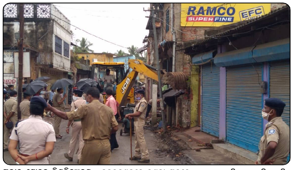
ପଂଜାବ ମୋହନ ବିଶ୍ୱବିଦ୍ୟାଳୟ ସମେତ ବହୁ ଶିକ୍ଷାନୁଷ୍ଠାନ ଏବଂ ଶିଳ୍ପାନୁଷ୍ଠାନକୁ ଦୈନିକ ହଜାର ହଜାର ଲୋକେ ଯା'ଆସ କରିଥା'ନ୍ତି । ମାଡ଼ି ରେମୁଣା ବଜାରରେ ଏହି ରାସ୍ତାପାର୍ଶ୍ୱକୁ ଉଦ୍ଧାର କରିବା ପାଇଁ ପ୍ରଚେଷ୍ଟା କରାଯାଇଛି । ଗୋଟିଏ ନିମିଷରେ ରାସ୍ତାର ଉଲ୍ଲେପ ପାଇଁ ଅବକାଶ ଦିଆଯାଇଛି । ଶହ ଶହ ଯାନବାହାନକୁ ଘଣ୍ଟା ଘଣ୍ଟା ଧରି ଅପେକ୍ଷା କରିବାକୁ ପଡୁଥିଲା । ଭିଡ଼ କମାଇବାକୁ ରେମୁଣା ପୁଲିସ୍ ବଳଦ୍ୱାରା ବଳପୂର୍ଣ୍ଣ ସମସ୍ତ ଧରଣର ଟ୍ରାଫିକ୍ ଜାମ ହେବା ପକ୍ଷରେ ଆହୁରି ମଧ୍ୟ ଉଦ୍ଧାର କରାଯାଇଛି ।

ବାଲେଶ୍ୱର, ୦୭ (ନି.ପ୍): ବାଲେଶ୍ୱର ପ୍ରଶାସନର ଦୀର୍ଘବର୍ଷର ପ୍ରଚେଷ୍ଟା ଆଜି ସଫଳ ହେବା ସହ ରେମୁଣା ବଜାର ରାସ୍ତା ପାର୍ଶ୍ୱର ଉଲ୍ଲେପ ଆରମ୍ଭ ହୋଇପାରିଛି । ଜନସାଧାରଣଙ୍କ ସହଯୋଗ ସହ ଏବେ ମୁଢ଼ିରେ ଥିବା ପ୍ରଶାସନିକ ଚିମ୍ପି ଏହି ରାସ୍ତାର ଉଲ୍ଲେପ ପାର୍ଶ୍ୱ ମାଡ଼ିବସିଥିବା ବୋଲି ନେଇ ଭଲଭାବରେ କାର୍ଯ୍ୟ କରିଥିବା ବେଶ୍ ବାବୁ ମିଳିଛି । ଆସନ୍ତା ଦୁଇଦିନ ମଧ୍ୟରେ ୨୫୫୫ ଅଧିକ ବୋଲି ଗୁଡ଼ି ଉଲ୍ଲେପ ପାଇଁ ଲକ୍ଷ୍ୟ ଥିବା ରେମୁଣା ବଜାରର ଚାରି ନାୟକ ସୂଚନା ଦେଇଛନ୍ତି । ପଡ଼ୋଶୀ ମୟୂରଭଞ୍ଜ ଜିଲ୍ଲାକୁ ସଂଯୋଗ କରୁଥିବା ଏହି ରାସ୍ତା ଦେଇ ରେମୁଣା ଥାନା, ରମାମା ପେପର ମିଲ୍ ଓ ବାଲେଶ୍ୱର ଆଲୋଏବ ଶ୍ରୀକମଳାଧର ମନ୍ଦିର, ଉତ୍ତରପଡ଼ା ଇତ୍ୟାଦି ସ୍ଥାନକୁ ଯିବାର ସୁବିଧା ହେବ ।