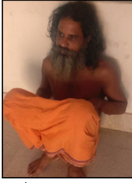
ଏହା ଫଳରେ ବାବା ଗଲେ ଜେଲ ହେଉଛି। ଏହା ଫଳରେ ବାବା ଗଲେ ଜେଲ ହେଉଛି। ଏହା ଫଳରେ ବାବା ଗଲେ ଜେଲ ହେଉଛି।

ନାଲଗିରି, ୨୭ (ନି.ପ୍ର.): ଜନେଇ ପୂଜକଙ୍କୁ ମାଡ଼ମାରି ବାବା ଗଲେ ଜେଲ ହେଉଛି। ଏହା ଫଳରେ ବାବା ଗଲେ ଜେଲ ହେଉଛି। ଏହା ଫଳରେ ବାବା ଗଲେ ଜେଲ ହେଉଛି।