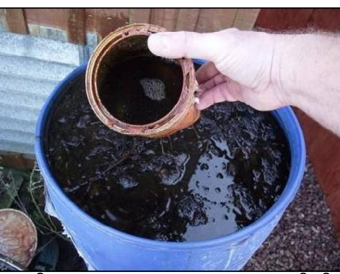
୧୦-୧୨ ଦିନ ପରେ ଏହା ବ୍ୟବହାର ଉପଯୋଗୀ ହୋଇଯାଏ । ଏହାକୁ ବରିଚା କିମ୍ବା ଚାଷ କ୍ଷେତ୍ରରେ ବ୍ୟବହାର କରାଯାଇପାରିବ । ଜୀବାମୃତ ମାଟିର ଉର୍ଦ୍ଧ୍ୱତା ବଢ଼ାଇବା ସହିତ ମିଠୁ ଜୀବାଣୁ ସଫା କରେ । ଜୀବାମୃତର ବ୍ୟବହାର ମାଟିରେ ଜିଆ ସଂଖ୍ୟା ବୃଦ୍ଧି କରିବ । ଯାହାଦ୍ୱାରା ମାଟି ହାଲୁକା ହେବା ସହ ମାଟିର ଜଳଧାରଣ କ୍ଷମତା ବୃଦ୍ଧି ପାରେ । ଏହାକୁ ସ୍ତେ' ଭାବରେ ମଧ୍ୟ ବ୍ୟବହାର କରାଯାଇପାରେ । ବର୍ତ୍ତମାନ ରାସାୟନିକ ସାଧନ ବିକଳ ଭାବେ ଜୀବାମୃତ ବେଶ୍ ଆଦୃତ ଓ ଗ୍ରହଣୀୟ ।

ଜୈବିକ କୃଷିକୁ ଏବେ ସମସ୍ତେ ଆପଣେଇବାକୁ ଚାହୁଁଛନ୍ତି । ଜଣାଶୁଣା, ପ୍ରକୃତ, ଦଶନ୍ଧି ବ୍ୟବହାର ବାଦ୍ ସମ୍ପୃତି ଜୀବାମୃତକୁ ଜୈବିକ କୃଷି ପାଇଁ ବ୍ୟବହାର କରାଯାଉଛି । ଜୀବାମୃତର ଚାହିଦା ଏବେ ବଢ଼ିବାକୁ ଲାଗିଛି ଏବଂ ତା' ସହ ଜୈବିକ କୃଷିର ଏକ ନୂଆ ଦିଗ ଭାବେ ଏହା ଉଦ୍ଭା ହୋଇଛି । ଜୀବାମୃତ ଏକ ତରଳ ଜୈବିକ ଖତ । ନାଉଟ୍ରୋଜେନ୍, ପଟାସ୍, କାର୍ବନ୍ ପରି ପୋଷକତତ୍ତ୍ୱ ଯୋଗାଇଲା ଭଳି ଏକ ନୂତନ ଆରମ୍ଭ ଜୀବାମୃତ । ଏହାକୁ ଖୁବ୍ ସହଜ ଉପାୟରେ ଏକ କମ୍ ସମୟ ମଧ୍ୟରେ ପ୍ରସ୍ତୁତ କରାଯାଇପାରେ । ଜୀବାମୃତ ସହିତ ଅନ୍ୟ ଖତକୁ ମିଶ୍ରିତ କରି ମଧ୍ୟ ବ୍ୟବହାର କରାଯାଇହେବ । ଏହାକୁ ପ୍ରସ୍ତୁତ କରିବା ପାଇଁ ୧ ହଜାର ଲିଟର ପାଣି, ୫୦ କିଗ୍ରା ଗୋବର, ୧୦-୧୨ କିଗ୍ରା ବେସନ୍, ୧୦-୧୨ କିଗ୍ରା ଗୁଡ଼, ଗଛ ମୂଳରୁ କିଛି ବାଲି ବ୍ୟବହାର କରାଯାଏ । ଏସବୁକୁ ଗୋଟିଏ ପାତ୍ରରେ ମିଶ୍ରଣ କରି ଗୋଲାର ସୁସ୍ଥାଲୋକଠାରୁ ଦୂରରେ ଅର୍ଥାତ୍ ସ୍ଥାନ ସ୍ଥାନରେ ରଖିବେ । ଦାମି ଦିନ ପର୍ଯ୍ୟନ୍ତ ପ୍ରତ୍ୟହ ୧୦ ମିନିଟ୍ ଲେଖା ଏହି ମିଶ୍ରଣକୁ ଭଲ ଭାବେ ଘାଣ୍ଟିବା ଆବଶ୍ୟକ ।